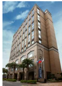
中和福朋喜來登飯店